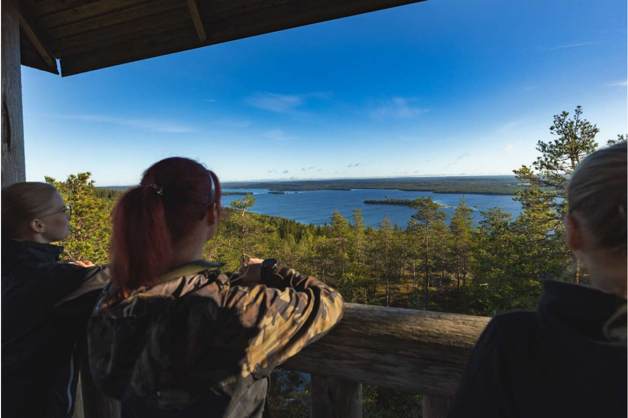
Kiparin laella olevasta näköalatornista aukeaa komeat maisemat Keyrittöjärvelle