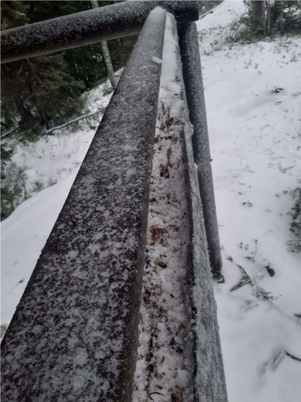
Torni alkaa lahota ja tulee lähivuosina käyttöikänsä päähän turvallisuuden näkökulmasta